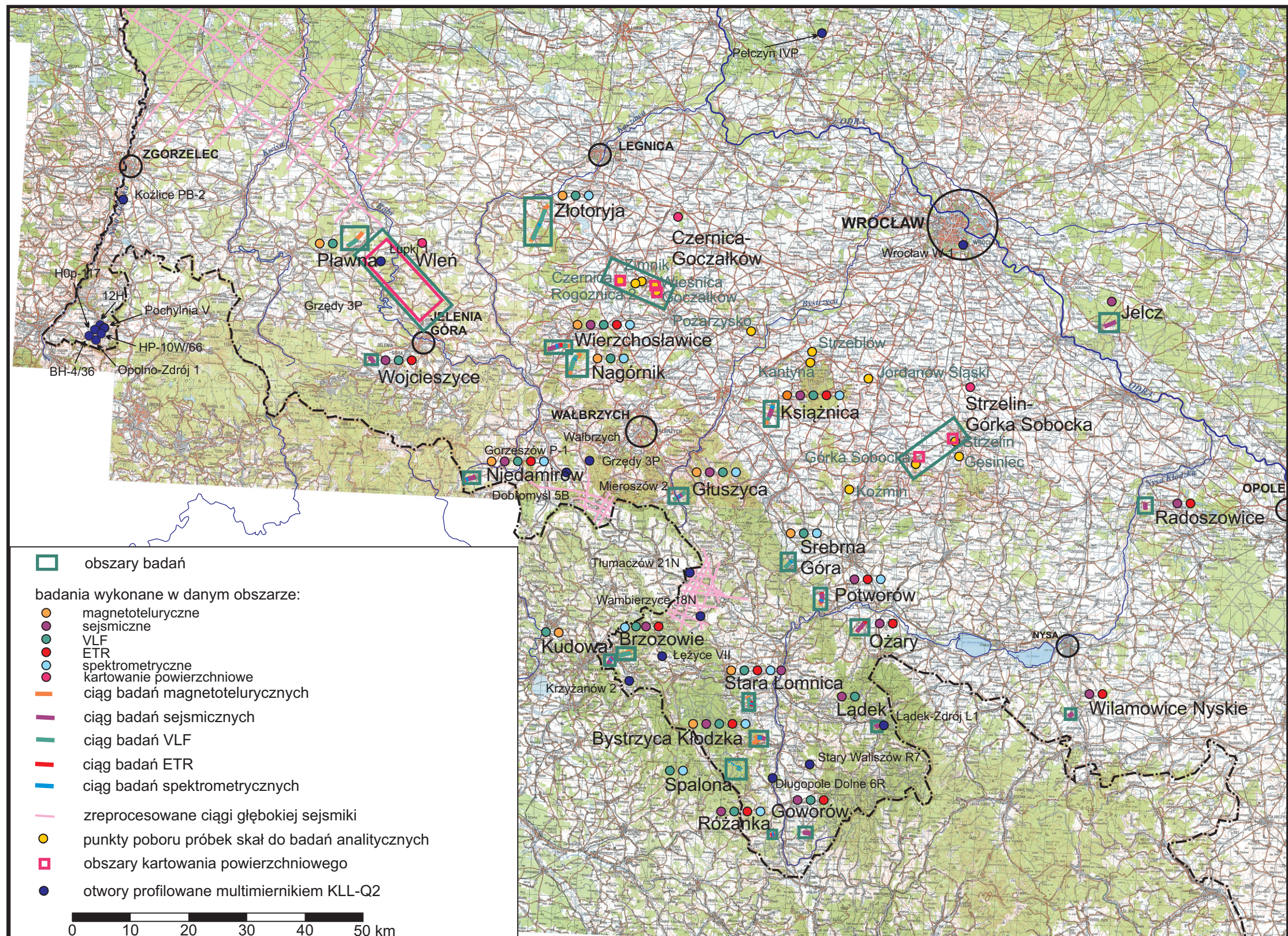
Fig. 1.2.1d Lokalizacja badań prowadzony w ramach II etapu projektu „Młode strefy tektoniczne a warunki geotermalne w Sudetach w świetle badań geochronologicznych, strukturalnych i termometrycznych –Etap II” na tle mapy topograficznej.